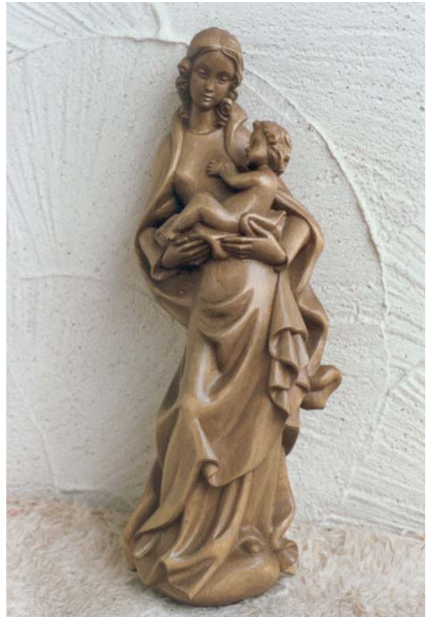
Holzschnitzarbeit, Madonna mit Kind