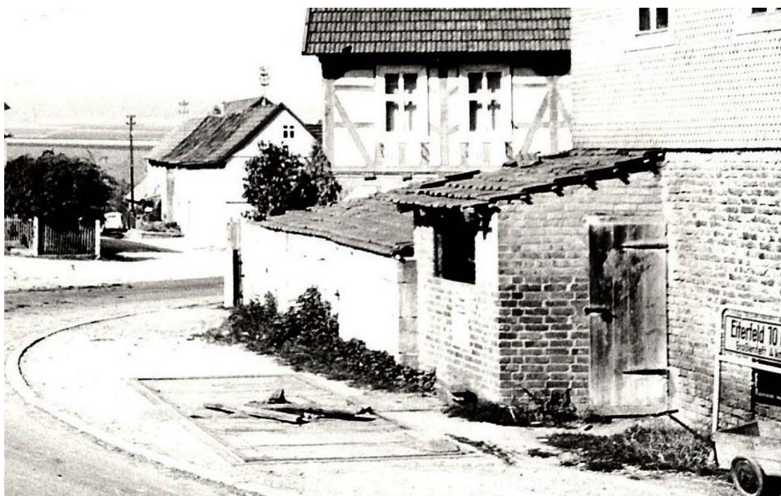
Die Rasdorfer große Viehwaage