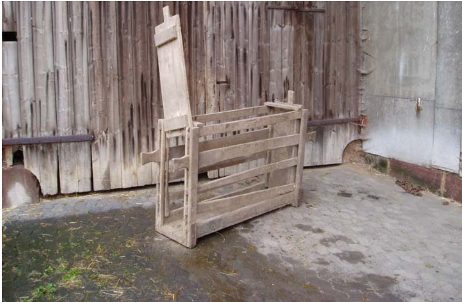
Wiege- und Transportkiste für Schweine

Die Schweine wurden in einer sogenannten Saukiste auf die Viehwaage gestellt und gewogen. Das nachstehende Bild zeigt eine Saukiste aus der damaligen Zeit, die heute noch im Besitz von Hermann Röhr ist. Dieser hat sie für unsere Aufnahmen zur Verfügung gestellt.