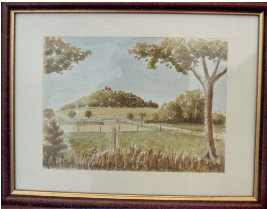
Der Gehilfersberg - Aquarellmalerei